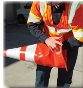
Sin PVC rajado o arruinado, simplemente vuelve a dar forma.