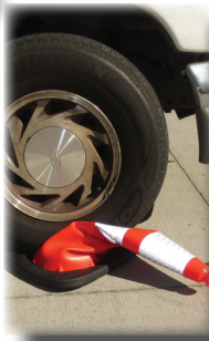
Impacto a neumáticos