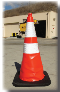
Deje caer la sección cónica y vuelva a utilizar.